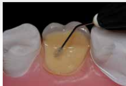
Applikation von Adhese Universal und anschließende Polymerisation