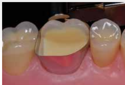
Anlegen der Matrice