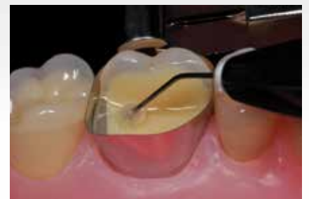
Applikation von Adhese® Universal und anschließende Polymerisation