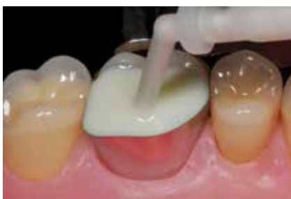
Applikation von MultiCore Flow