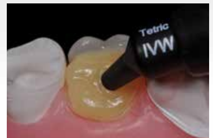
Applikation von Tetric EvoCeram Bulk Fill