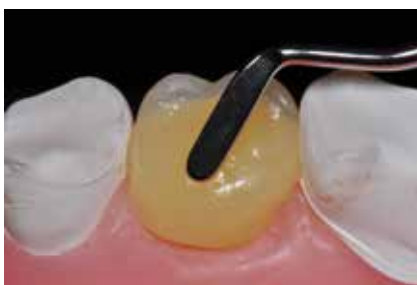
Modellieren der Aufbaufüllung