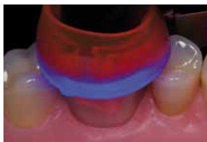
Polymerisation mit Bluephase Style