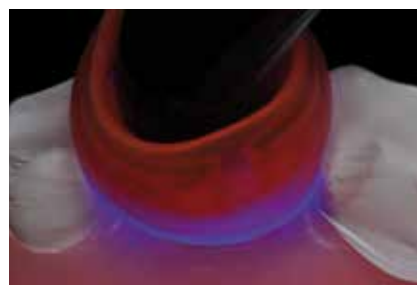
Polymerisation mit Bluephase Style